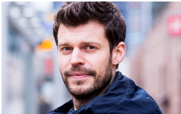
Rødt-leder: Bjørnar Moxnes.

– Vi foreslår at alle som tjener mindre enn 600.000 skal få utbetalt klimarabatt. Vår modell vil gi omlag 1000 kroner hver til personer med under 600 000 i inntekt, og 1400 kroner til de som tjener under 250 000. Vi foreslår også et