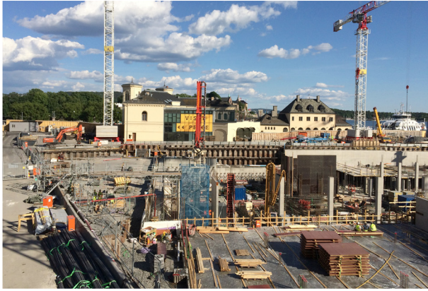
Nasjonalmuseet: Bygningsarbeid på Vestbanetomten i Oslo, her frå juni 2016.