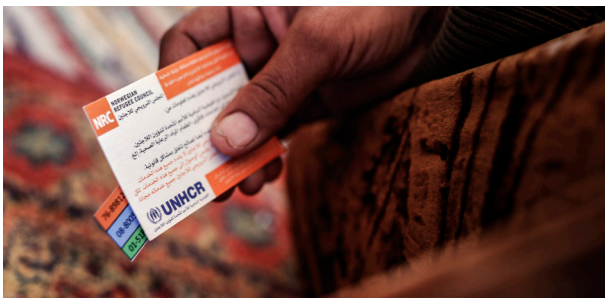
Krise: 70 millioner mennesker er på flukt i verden.