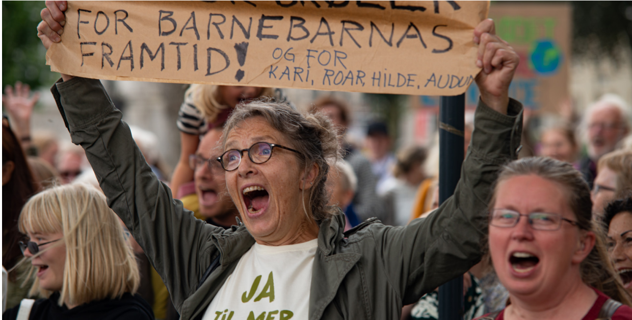
Krever handling: Fra Klimabrolet i Kristiansand 30. august 2019.