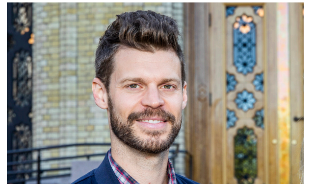
Rødt-leder: Bjørnar Moxnes.

– Jeg lærer som regel mer av å reise rundt på