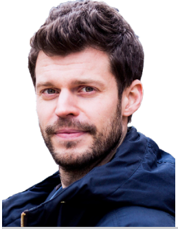
Bjørnar Moxnes b.moxnes@roedt.no Leder i Rødt