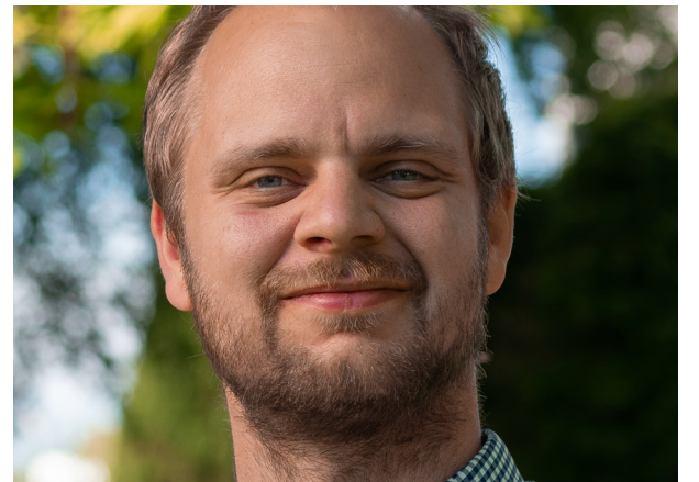
Forfatter: Mímir Kristjánsson.

og har i haust kome med boka Mamma er trygda . Han meiner det det verste er at Nav-rettsforfølginga har kunne pågått så lenge.