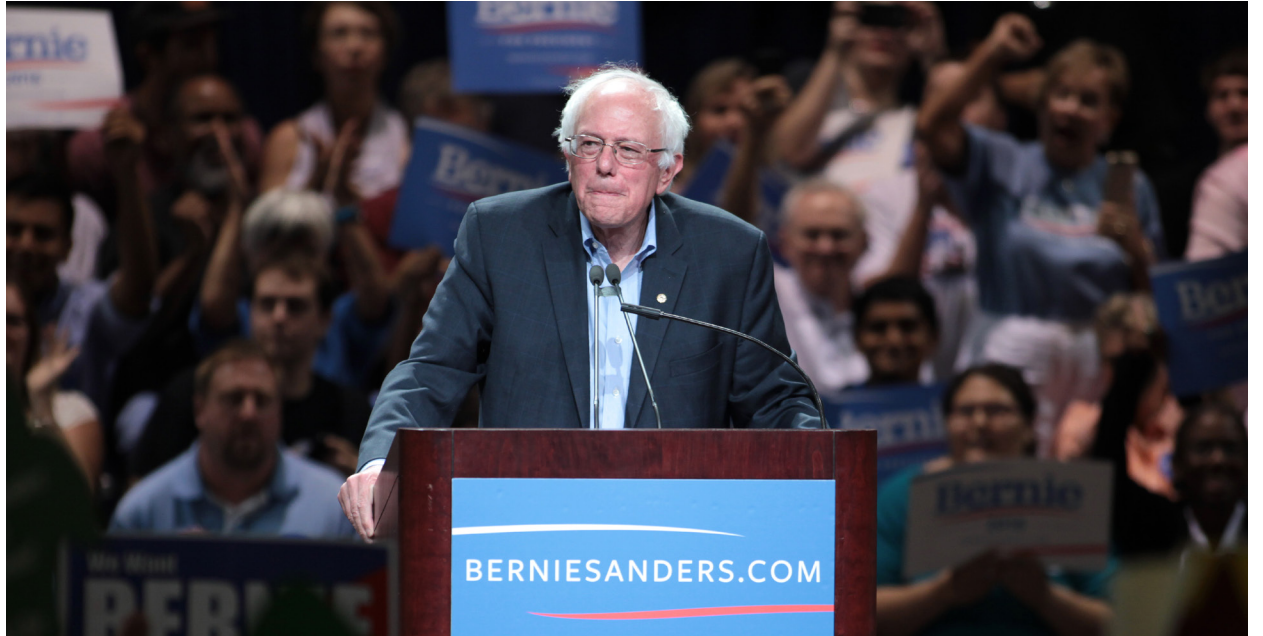
Amerikansk sosialist: Bernie Sanders.