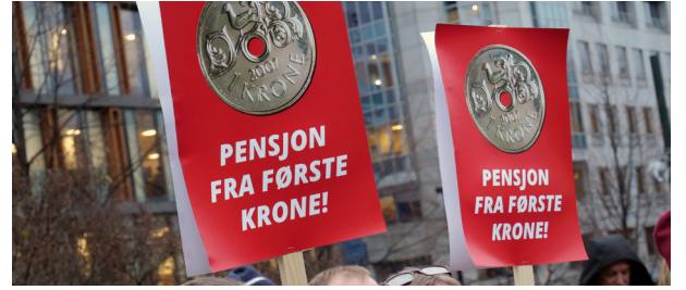
Vant fram: Sykehusansatte får framover pensjon fra første krone.